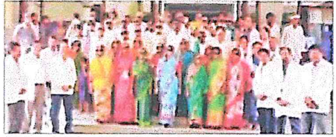
ವಿಜಯಪುರ ನೇತ್ರ ರಸ್ತೆಚಿಕ್ಕಿಗೆ ಬಳಿಕ ಗುಣಮುಖರಾಗಿ ತಮ್ಮ ಗ್ರಾಮಗಳಿಗೆ ತೆರಳಿದ ರೋಗಿಗಳು.

ಶಿಬಿರದಲ್ಲಿ 190ಕ್ಕೂ ಹೆಚ್ಚು ರೋಗಿಗಳಿಗೆ ತಪಾಸಣೆ ಮಾಡಲಾಯಿತು. ರಸ್ತೆಚಿಕ್ಕಿಗೆ ಆಗತ್ಯವಿದ್ದ 40 ರೋಗಿಗಳಿಗೆ ಬಿಎಲ್‌ಡಿಎಂ ಆಸ್ಪತ್ರೆಯಲ್ಲಿ ಉಚಿತ ನೇತ್ರ ಚಿಕಿತ್ಸೆ ನೀರವೇರಿಸಲಾಯಿತು ಎಂದು ನೇತ್ರ