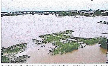
ಮುಧೂಳಕ್ಕೆ ಸುಗ್ಗತ್ತಿದ ಘಟವುಳ ನೀರು ಪ್ರವಾಹಕ್ಕೆ ತತ್ತರಿಸಿದೆ.

ಪ್ರವಾಹ: ಕಡಲ ಮಟ್ಟದಿಂದ ಮುಂದೆ ಸುಗ್ಗತ್ತಿದ ಘಟವುಳ ನೀರು ಪ್ರವಾಹಕ್ಕೆ ತತ್ತರಿಸಿದೆ. ಮುಧೂಳಕ್ಕೆ ಸುಗ್ಗತ್ತಿದ ಘಟವುಳ ನೀರು ಪ್ರವಾಹಕ್ಕೆ ತತ್ತರಿಸಿದೆ. ಮುಧೂಳಕ್ಕೆ ಸುಗ್ಗತ್ತಿದ ಘಟವುಳ ನೀರು ಪ್ರವಾಹಕ್ಕೆ ತತ್ತರಿಸಿದೆ.