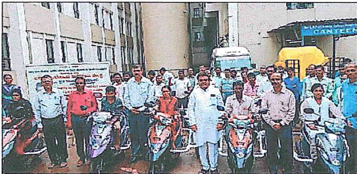
ವಿಜಯಪುರದ ಬಿಎಲ್‌ಡಿಇ ಆಸ್ಪತ್ರೆಯಲ್ಲಿ ಶಾಸಕರ ಅನುದಾನದಲ್ಲಿ ಬುಲೆಟ್‌ನಿಂದ ಕ್ಷೇತ್ರದ ವಿಶೇಷಚೀತನರಿಗೆ ತ್ರಿಚಕ್ರ ವಾಹನ ಹಾಗೂ ಕೃತಕ ಅಂಗಾಂಗ ಸಾಧನಗಳನ್ನು ಶಾಸಕ ಎಂ.ಬಿ.ಪಾಟೀಲ ಒದಗಿಸಿದರು.